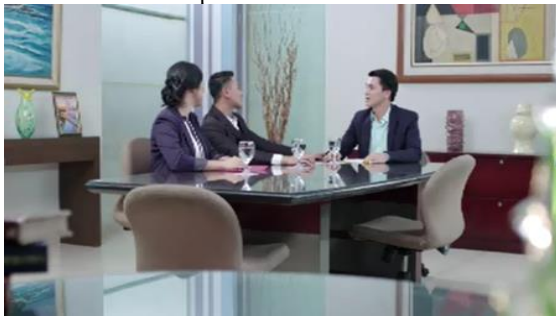
Gambar 2 Contoh Materi Video ILM Mudik Versi Keselamatan

Aspek konatif selanjutnya adalah mengukur perubahan perilaku yang akan atau sudah dilakukan oleh respnden setelah melihat iklan tersebut. Secara keseluruhan responden akan/ sudah melakukan membawa barang seperlunya disaat mudik, yaitu sebesar 62.8%. Kemudian yang kedua adalah merencanakan perjalanan sebaik mungkin sebesar 51.6% dan yang ketiga adalah datang lebih awal sebesar 29.0%. Untuk responden di Semarang justru yang ketiga adalah mematuhi semua prosedur sebesar 32.0%.