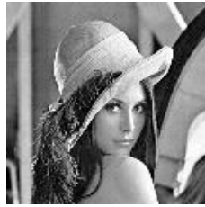
Gambar 1. Citra Lena.