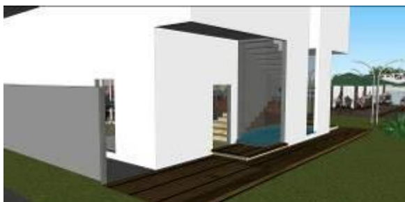
Gambar 13 Kajian Pemodelan