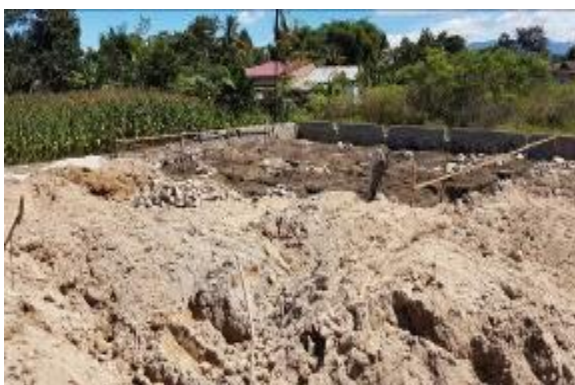
Gambar 5 Tampak belakang daerah restoran

Perancangan fasilitas restoran pada kawasan Delaga Biru. Pengunjung yang ingin akan