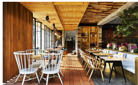
Gambar 6 Referensi image restoran bertema tropis Sumber : http://adespo.com/blog/tag/restoran/ . 2017

Tema perancangan interior restoran ini adalah “ Tropical Nature ”. Dalam perancangan restoran dibuat ruang yang mengacu kepada kondisi ruangan yang nyaman dan sehat. Nyaman bukan hanya dapat diperoleh dari keergonomisan tetapi juga dapat melalui suasana ruang dan pengaruh psikologi ruang. Kata tropis berasal dari kata benda tropis yang kondisi iklim geografis yang berada pada daerah khatulistiwa. Oleh karena karakternya yang panas dan kelembaban yang tinggi, perlu perancangan yang mampu untuk mengatasi iklim seperti ini seperti ukuran pintu dan jendela yang besar dan dikelilingi oleh ventilasi. Pada arsitektur tropis sekarang banyak yang memiliki karakter seperti paduan warna cerah dan natural serta penggunaan material alam yang berhubungan dengan pendekatan ekologis pada interior.