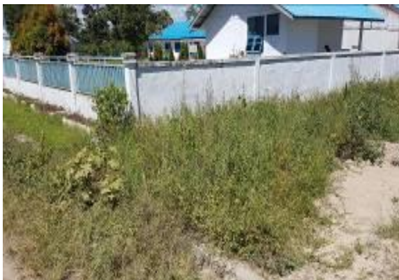
Gambar 4 Tampak depan kanan area