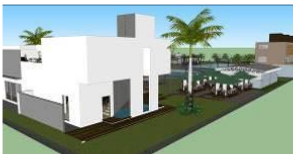
Gambar 14 Kajian Pemodelan