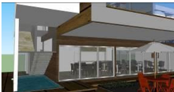
Gambar 12 Kajian Pemodelan