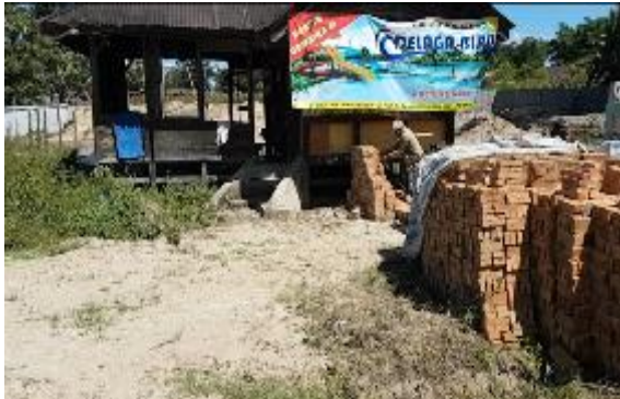
Gambar 3 Tampak depan area parkir

Delaga Biru yang berlokasi di Jl. Prof. Tarnama Sinambela, sebelah Puskesmas Narumonda, Kec. Siantar Narumonda, Porsea, Kab. Tobasa.